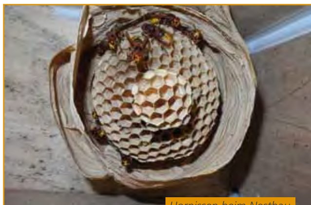
Hornissen beim Nestbau

„Carpe Diem“ heißt es für die Hornissen. Die Königinnen, die am längsten leben und ein Jahr alt werden, leisten in dieser Zeit Unglaubliches. Eine einzelne Königin sucht sich im späten Frühjahr einen geeigneten Niststandort und gründet einen ganzen Staat. Dazu bevorzugt sie dunkle Hohlräume, wie es sie in Bäumen gibt. Als Folge des Mangels an natürlichen Höhlungen finden sich ihre Nester auch auf Dachböden, in Geräteschuppen, Vogelnistkästen und Rollladenkästen. Letzteres ist jedoch ein für Mensch und Tier ungünstiger Standort. Das Besprühen von möglichen Einflugbereichen am Rollladenkasten mit Nelkenöl oder anderen ätherischen Ölen im Frühjahr, kann eine Hornissenkönigin abhalten ihren Staat dort zu gründen.