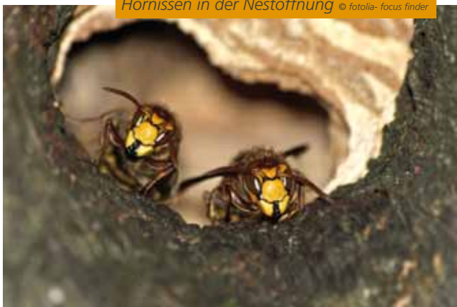
Hornissen in der Nestöffnung

Wer doch einmal gestochen wird, sollte die Stichstelle kühlen – mehr ist meist nicht nötig. Bei Stichen im Mund- und Rachenraum sollte man aber auf jeden Fall vorsichtshalber einen Arzt zu Rate ziehen. Bis dahin kann man am besten ein Eis lutschen. Auch wenn man im Volksmund irrtümlicherweise sagt, „Sieben Stiche töten ein Pferd, drei Stiche einen Menschen“, so sind Hornissenstiche keineswegs gefährlicher als die anderer Wespenarten oder von Honigbienen. Lediglich Allergiker sollten besonders vorsichtig sein und ein Allergiebesteck mitführen.